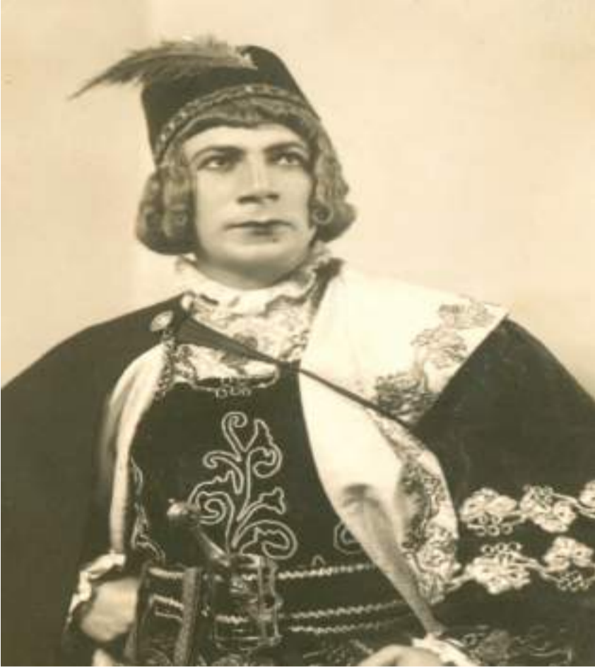
فتوح نشاطي في تاجر البندقية