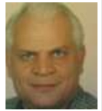
تأليف: ستيف ديكسون ترجمة: أحمد عبد الفتاح

ولعل إحدى هذه المبادرات كانت «حلول تعاونية للفنون الأدائية: منصة التواجد عن بُعد»، بقيادة الفنانين والباحثين المتخصصين في مجال الاتصالات عن بُعد بول سيرمون (الباحث الرئيسي، جامعة برايتون، المملكة المتحدة) وستيف ديكسون (الباحث المشارك، كلية لاسال للفنون، جامعة الفنون في سنغافورة) بالتعاون مع مستشاري البحث سيتا بوبات تايلور، وساتيندر جيل، راندال باكر. وقد استجابت هذه المبادرة للأزمة التي عصفت بالفنون الأدائية الحية بعد إغلاق المسارح وعدم قدرة الفنانين على التصميم والإبداع والتدرب معاً وجهاً لوجه خلال فترات الإغلاق.