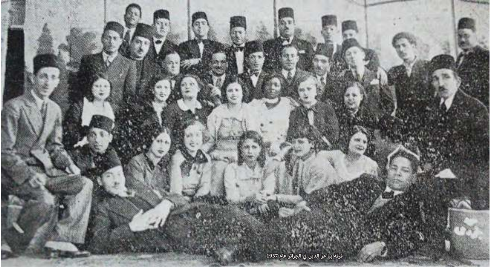
فرقة ببا عز الدين في الجزائر عام 1937

أن يستكمل الموضوع باحثون آخرون من بلدان المغرب العربي - ليبيا وتونس والجزائر والمغرب - ويتبعون ظهور هذه العروض في بلدانهم بعد عام 1937، وهل ما قدمته فرقة ببا عز الدين من إسكتش (مصر الحديثة)، الذي يدعو إلى الثورة على المستعمر، وما بثته من فقرات ومونولوجات ساخرة ضاحكة في الإذاعة الجزائرية.. إلخ، هل هذه العروض كانت سببا في ظهور عروض (ون مان شو) في الجزائر وفي بقية بلدان المغرب العربي، لا سيما المدن التي زارتها الفرقة في كل بلد!!