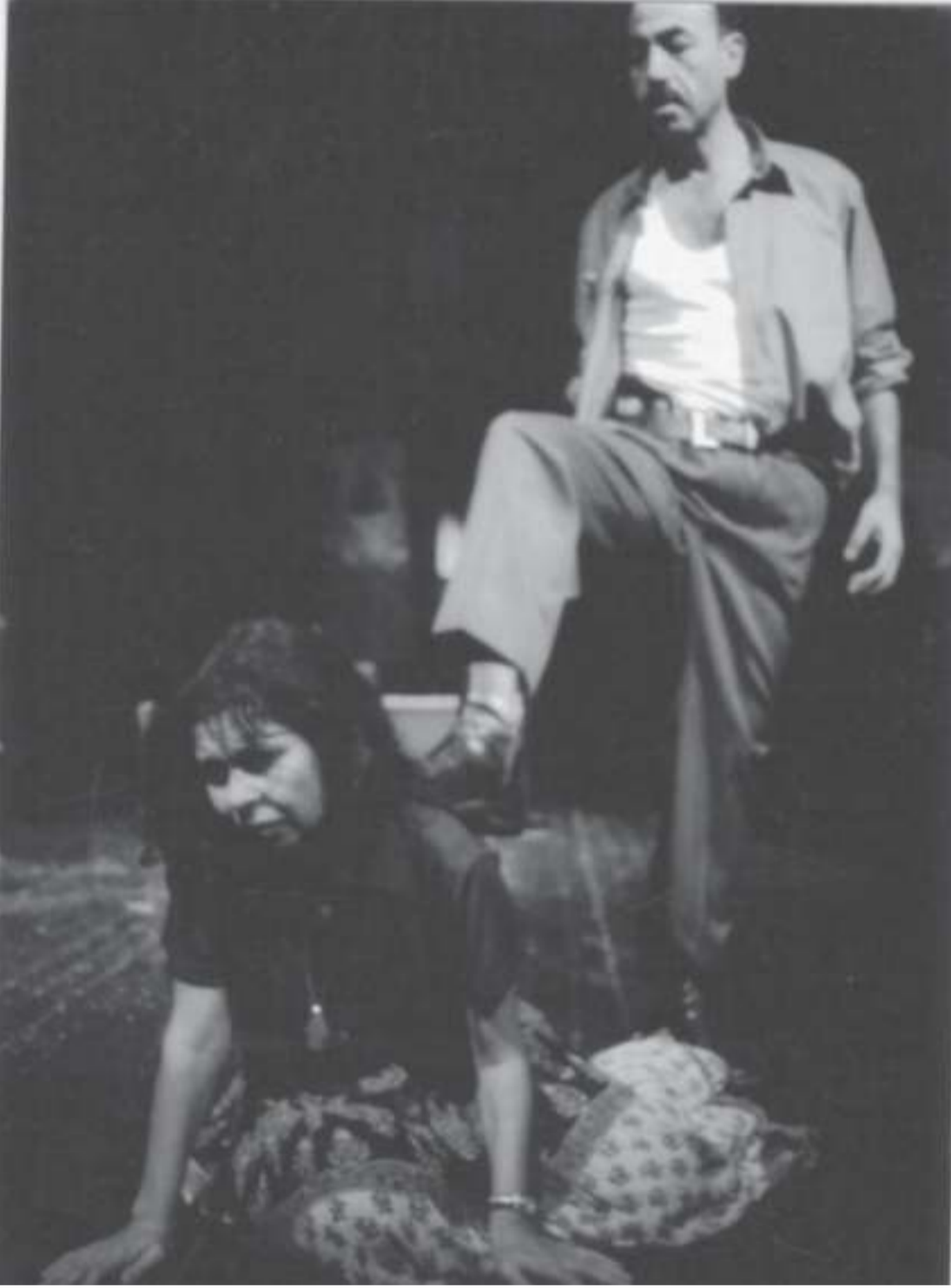
مدينتي المليانة بالزبالة والحسالة واللصوص والبصاين

ويحلم فيقول: يوما ما نتمناه ومنتظره وسنحارب من اجل بلوغه تحقيق حلم نهاد ومنحة والساوي والجريتي وكتيبه من الاخرين، كثيرين من سنة تسعين الحرية والاستقلال حتى لا نياس وحتى لا تتحول معركتنا لسراب وحتى لا يتحول حضورنا لعدم. للأمام .. للأمام.. بكره نوصل لأرض الأحلام